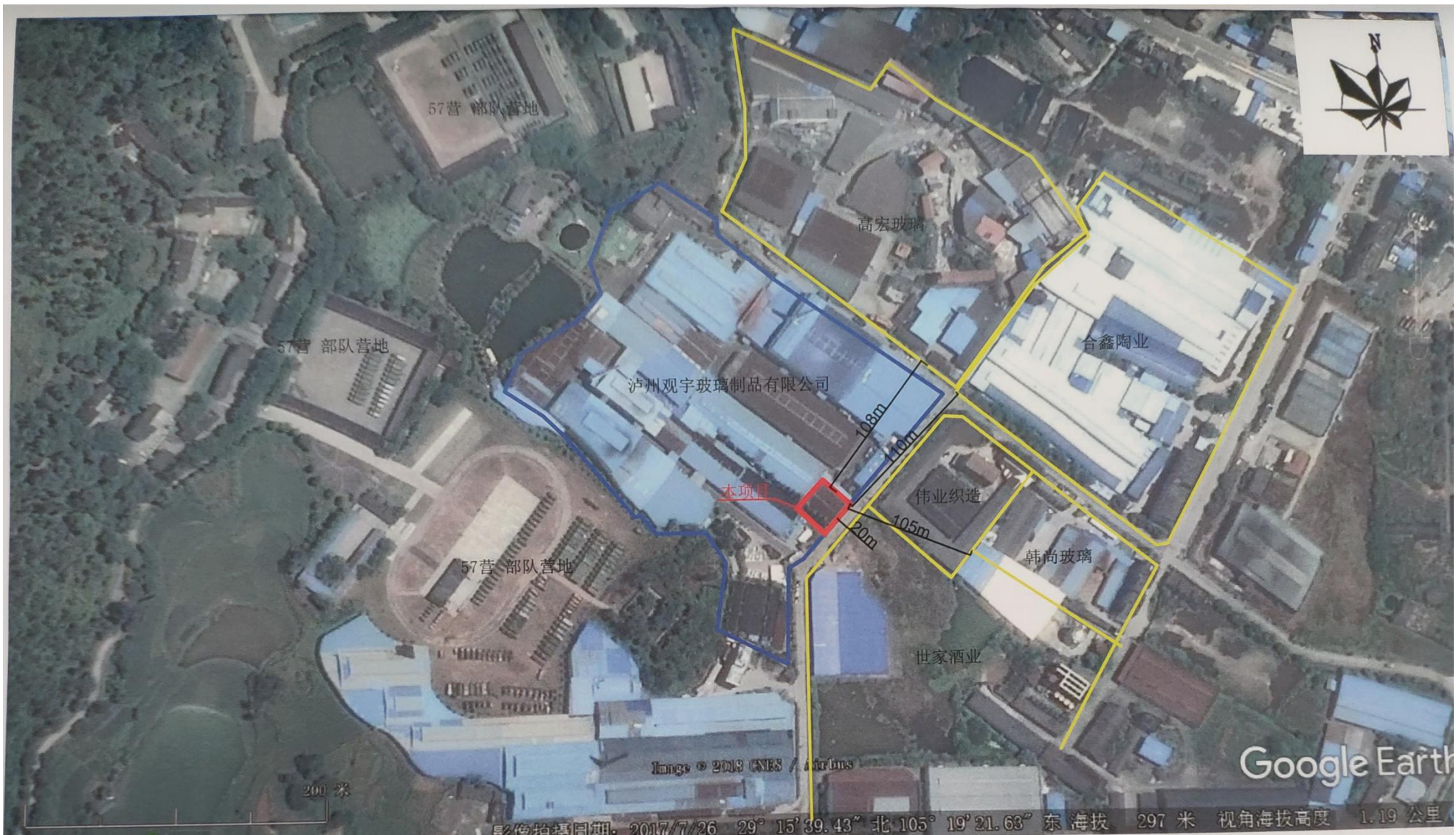
附图二 项目外环境关系图