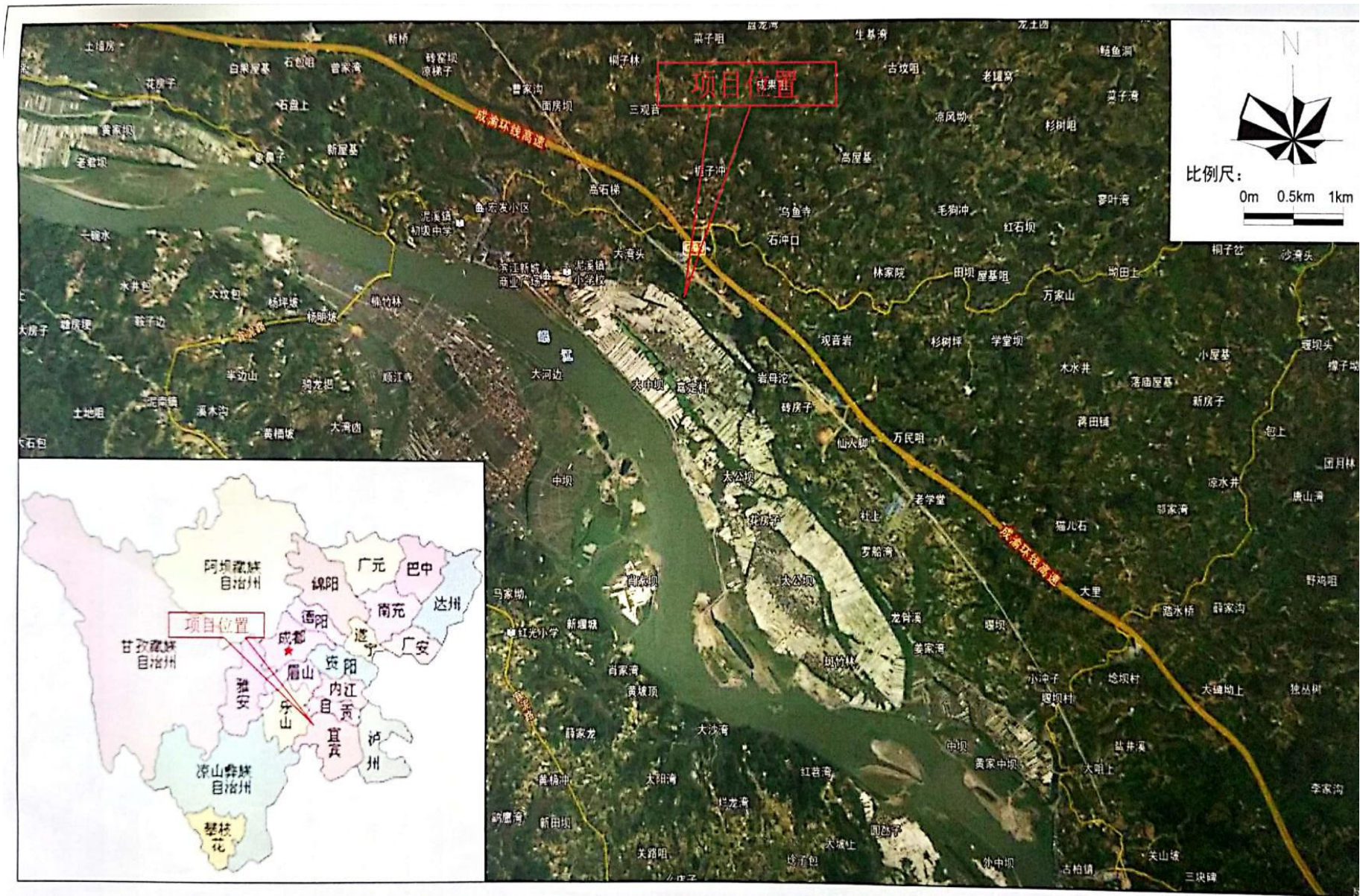
附图一 项目位置图